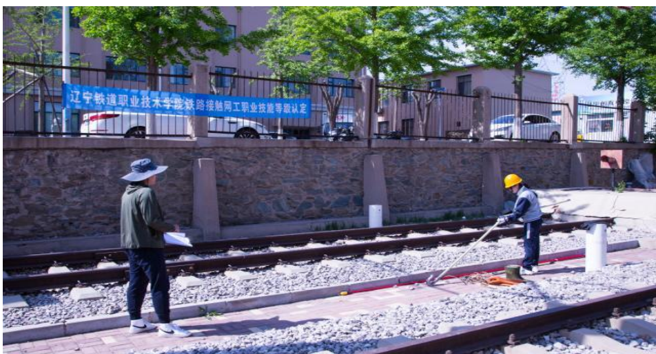
图3 技能鉴定考试现场