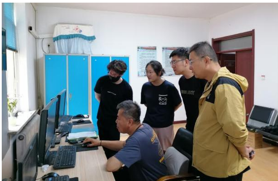
图4 学校教师到沈局站段现场参与企业实践