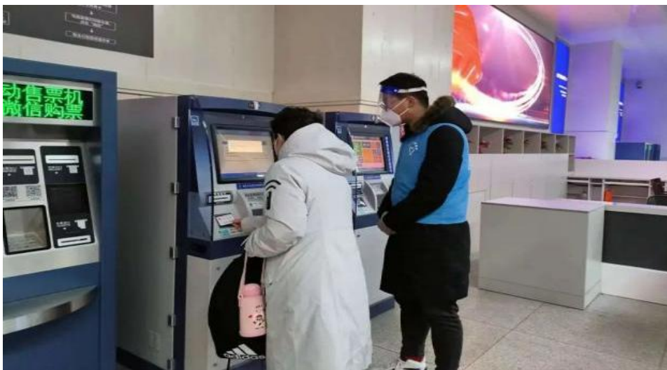
图5 学生志愿者团队在沈阳局下辖站开展志愿服务