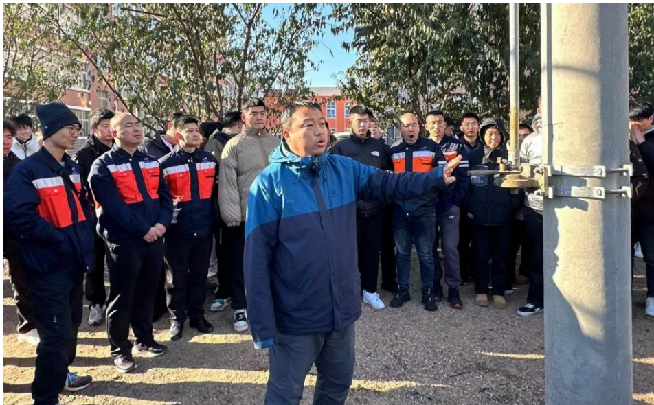
图2 “2+1”定向培养学习情况